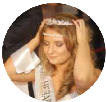
Корона ей к лицу

Она сияет, светится, смеется: и копна волнистых непослушных волос, и вся в каком-то умопомрачительном наряде, в шелках и кружевах: ну Дашка-очаровашка, слов иных нет!