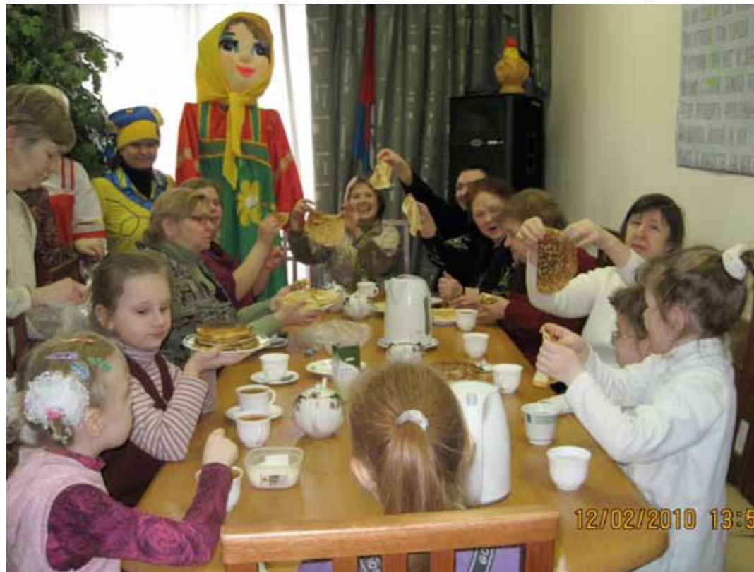
Чаепития у нас всегда проходят весело

ствия в трудоустройстве. По медицинским показаниям можно посетить занятия АФК, тренажерный зал, сеансы на массажном кресле и сеансы релаксации (психологической разгрузки). У нас вы сможете подобрать себе занятие по душе для проведения досуга — это занятия с социальными педагогами: обучение макраме, вязание крючком или спицами, бисероплетение, кройка и шитье, ма-