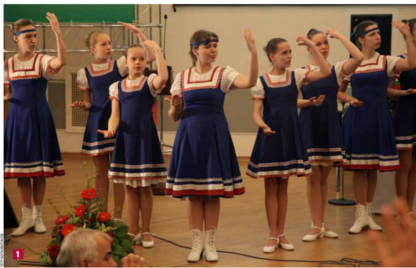
1 Выступают «Ангелы надежды» 2 Безбарьерной среде — быть!

граммы «Евро-сити», но для этого нам надо очень много и упорно работать, много сделать, идя этого у нас и возможности, и желание. В прошлом году, как вы знаете, у нас начала работу общественная инспекция по делам инвалидов, и я считаю, что советы по делам инвалидов должны быть созданы в каждом округе, в каждом районе. В Москве плодотворно работает Координационный совет по делам инвалидов, его возглавляет мэр столицы Сергей Собянин, его активными членами являются представители общественных организаций инвалидов. Вообще хочу особо подчеркнуть, что в жизни нашего города, в решении тех сложных проблем, о которых мы говорим, социальное партнерство, роль общественности, а в данном случае — роль общественных организаций инвалидов — трудно переоценить. И, пользуясь случаем, я хочу сегодня искренне поблагодарить наших общественников, лучших представителей общественных организаций города — такими людьми мы по-