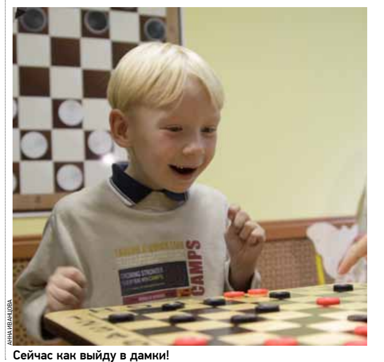
Сейчас как выйдут в дамки!

проходит праздник совместно с управой Тверского района — с подарками, призами, концертом и т.д. Вообще, добрых и отзывчивых людей у нас много, и мы в этом убеждались не раз на собственном опыте, и хочется сказать огромное спасибо всем тем, кто помогает нам жить, работать, воспитывать детей, водить их в театры, на выставки и т.д. Не так давно в кафе «Ростикс» на Маяковской состоялся благотворительный вечер, устроенный специально для нас, особо нуждающихся мамы-инвалиды получили посильную материальную помощь, были и веселые конкурсы для детей, призы и сладкие подарки. А 1 июня, в Международный день защиты детей, у нас будет большой детский праздник в Луна-парке «Карусель». И ребята, и мамы с особым нетерпением ждут этого дня. А еще хочу сказать, что наша организация имеет свою историю и традиции, и многие из тех, кто когда-то в конце 90-х приходил к нам вместе с мамой — выросли, завели свои семьи — мамы и своих детей, но связей с нами не порывают. Наша программа и цель очень простые: мы хотим, чтобы все дети и их родители были счастливы. А наш девиз — давайте помогать людям и любить друг друга!