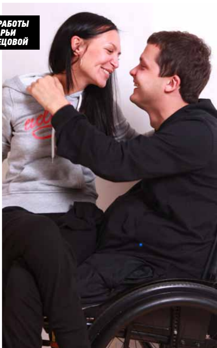
«Тебе хорошо со мной?»

любой, преодолевших отчаяние. Прорыв, спасение, свет надежды, реальная возможность жить! А не прозвять, доживать, существовать... Так рождалась идея Интеграционного клуба в стенах давно уже ставшего ей родным Реабилитационного центра «Преодоление». Клуба как сообщества разных людей, клуба, соединившего в себе самые разные жанры и виды творчества. Клуба, который создан для того, чтобы помочь людям найти себе занятие по душе или научить какому-либо виду творчества, которое вполне может стать и возможностью дополнительного заработка — или даже основной профессией!