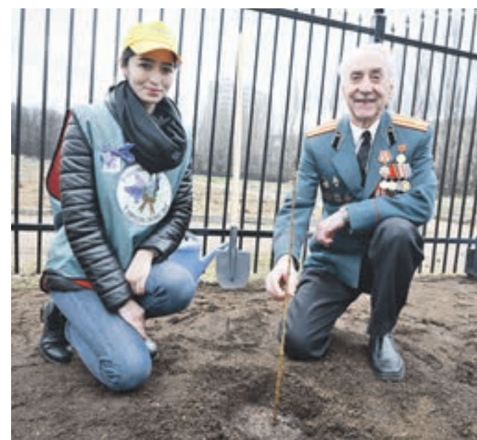
В эти дни акция «Сирень Победы» проходит не только в Крыму, но и в Москве. 18 апреля 11:32 Высадка кустов сирени в Ботаническом саду