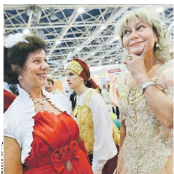
6 ноября 2014 года. Участники форума-выставки уверены, что жизнь на пенсии может быть яркой и интересной

В «Экспоцентре» на Красной Пресне с 3 по 5 ноября в очередной раз пройдет Международный форум-выставка «50 плюс». Все плюсы зрелого возраста. Главная цель мероприятия, проводимого при поддержке Департамента труда и социальной защиты населения Москвы, — показать, насколько разнообразной и интересной может быть жизнь после выхода на пенсию. Форум объединяет людей старшего возраста, которые хотят жить полноценно и активно, представителей бизнеса, предлагающих товары и услуги для пожилых, показывает работу органов власти по защите интересов пенсионеров. — Правительство Москвы, социальные службы города делают все, чтобы нацелить людей на достойную жизнь и активное долголетие. Цель нашей работы — помочь пожилым москвичам реализовать все плюсы зрелого возраста, стимулировать малый и средний бизнес для производства товаров, востребованных именно этой категорией населения, — заметил министр правительства Москвы, руководитель Департамента труда и социальной защиты населения города Владимир Петросян. В течение трех дней посетители ждут 150 экспозицион-