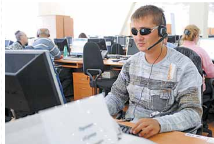
Найти работу инвалидам в Москве становится проще

Префектурами административных округов и управами районов ежегодно проводятся работы по приспособлению квартир инвалидов-колясочников и входных групп подъездов, в которых они проживают, а также прилегающих дворовых территорий. В 2011 году приспособление квартир инвалидов велось не только префектурами административных округов, но и за счет программных средств, предусмотренных Департаментом социальной защиты населения. По итогам года в рамках программы приспособлено 168 квартир инвалидов. Успешно реализован пилотный проект по установке поточной подъемной рельсовой системы в 190 квартирах лиц с тяжелыми ограничениями в передвижении. Разработаны новые архитектурно-технические решения по переустройству квартир на первых этажах серий массового строительства для проживания в них инвалидов-колясочников, с учетом всех существующих нормативных требований по обустройству таких квартир. В 2011 году были продолжены работы по обустройству улично-дорожной сети. В 2011 году на улицах города оборудовано 43 689 ступенек с тротуара на проезжую часть для удобства слабовидящих лиц и инвалидов-колясочников. Проводились работы по приспособлению для инвалидов подземных пешеходных тоннелей и общественных туалетов.