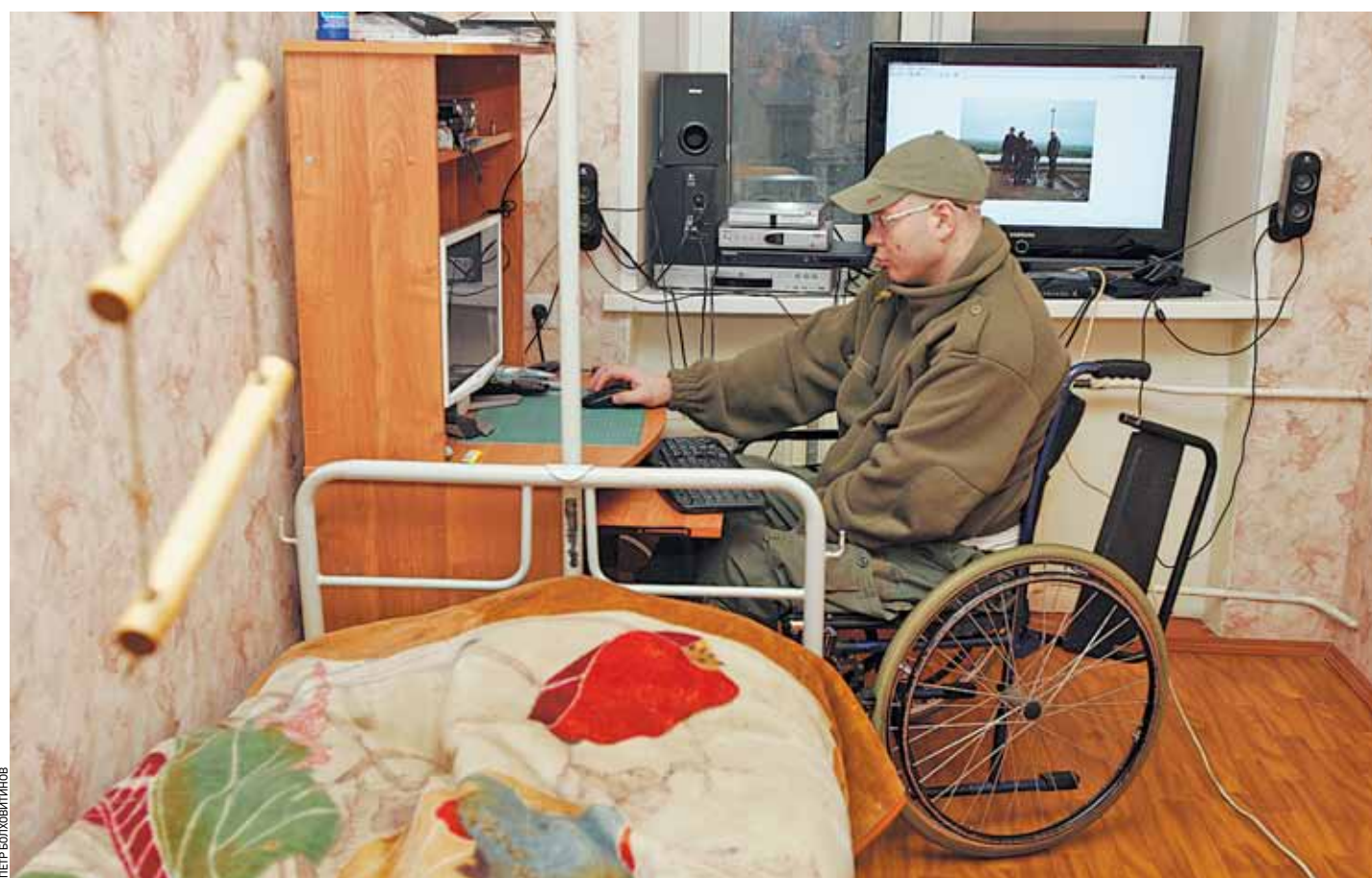
Без Интернета их жизнь и представить сегодня невозможно

Итак, по запросу «инвалиды» Гугл выдал список из 5 миллионов ссылок. Самый первый сайт: www.invalirus.ru, Всероссийский сайт инвалидов. Заставка в нежных тонах с цветущей вишней и надписью «Весна идет, широко шагая». И — куча самых разнообразных разделов. Как и на многих подобных порталах, здесь есть форум, чат, опция «найти друга», раздел знакомств — словом, все что нужно для веселого трепа. Однако есть и специфика. Например, в разделе «Информация» можно узнать о клиниках, реабилитационных центрах, новых технологиях в области медицины — протезировании, клеточной хирургии. Истории из жизни — о том, как это случилось, как здоровый человек стал инвалидом. Интересный опыт — путешествие без сопровождающего: девушка-колясочница проехала по маршруту Улан-Удэ — Новосибирск — Новокузнецк. Одна. А вот парень с недоуменным вопросом: почему на форуме запрещены темы о том, кто как зарабатывает? «Труд — это единственное, что может поддерживать человека, когда все рушится», — пишет он.