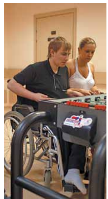
Идут соревнования по настольному футболу