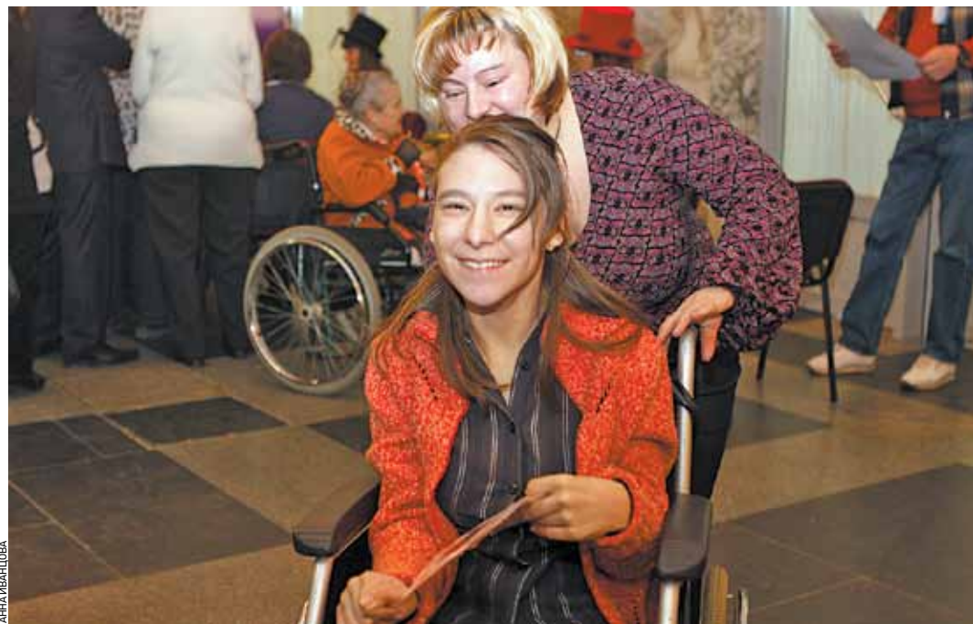
Для многих подопечных социальные работники становятся самыми близкими людьми

Различие, право же, не столь существенное — ведь важно то, что очень близки и схожи задачи, роль, служение социальных работников и у нас, и у них. Это — помощь бездомным и престарелым, инвалидам, сиротам и многодетным, поддержка людей, оказавшихся в трудной жизненной ситуации. И неважно, в какой части света они живут, на каком языке говорят — слова «забота», «милосердие»,